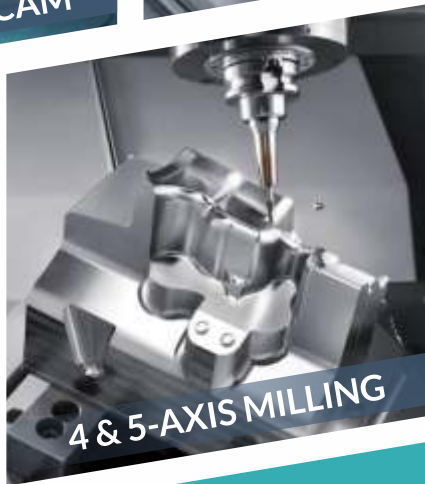
4 & 5-AXIS MILLING